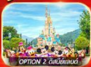
OPTION 2 ดิสนีย์แลนด์

เต็มอิ่ม ทั้งไหว้พระ-ขอพร การเงิน การงานความรักและซ่อมปัง รีพลัสเบย์ มงกิก วัดเขangkงหมิว เจ้าแม่กวนอิมของสำ วัดหวังต้าเซียน ซ่อมปังจิมซาจุ่ย