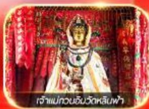
เจ้าแม่กวนอิมวัดหลินฟ้า