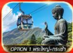
OPTION 1 พระใหญ่+กรงเจ้า