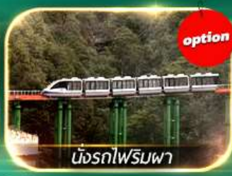
นั่งรถไฟรมพา