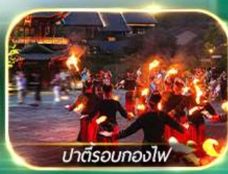
ปาตีรอกองไฟ