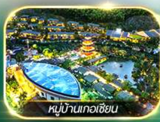
หมู่บ้านเกอเซียน