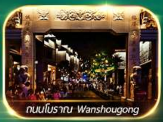
ถนนโบราณ Wanshougong

ตระการตาหุบเขาเทวดาฉีเจียนกู่ เช็กอินที่เที่ยงใหม่