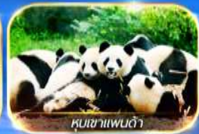
หุบเขาแพนด้า

สัมผัสความงามของธรรมชาติ 2 อุทยาน อุทยานจิวจ้ายโกวและอุทยานน้ำแข็งต้ากู่