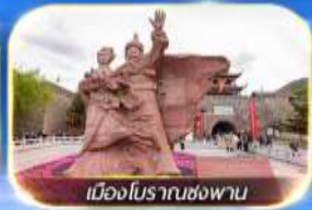
เมืองโบราณซ่งพาน