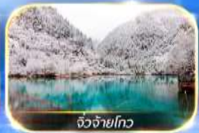
จิวจ้ายโกว