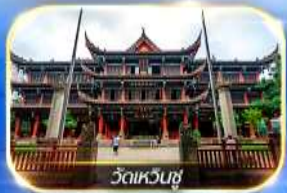
วัดเหวินชู่