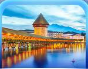
สะพานไมซ์าเปลา