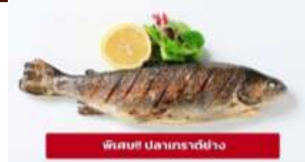
พินทุฟ ปลาเทราต์ย่าง

บริเวณ จตุรัสมาเรียนพลาทซ์ (Marienplatz) จตุรัสกลางใจเมืองในเขตเมืองเก่า ปัจจุบันที่เป็นเหมือนพื้นที่สำหรับงานพิธีต่างๆ ที่สำคัญของเมือง ถัดมาเป็น ศาลาว่าการใหม่ (New Town Hall) ที่ได้ใช้ทำการแทนศาลาว่าการเก่าตั้งแต่ปี 1874 เห็นได้ง่ายด้วยหอคอยแหลมสูงและการออกแบบและตกแต่งอย่างประณีตไม่แพ้ปราสาทหรือพระราชวัง บริเวณใกล้กันนั้นเป็น ศาลาว่าการเก่า (Old Town Hall) เป็นอาคารสีขาวสะอาดหลังนี้เป็นศาลาว่าการของเมืองมิวนิกมาตั้งแต่ปี 1310 แม้จะผ่านมากกว่า 700 ปี แต่ก็ยังสวยและสง่า สัญลักษณ์แห่งการฟื้นคืนชีพ มหาวิหารเฟราเอน (Frauenkirche) หรือที่รู้จักกันในชื่อ โบสถ์แม่พระเดรสเดน เป็นหนึ่งในแลนด์มาร์คที่โดดเด่นที่สุดของเมืองเดรสเดน ประเทศเยอรมนี โบสถ์หลังนี้มีประวัติศาสตร์อันยาวนานและน่าสนใจ จากนั้นให้ท่านอิสระเดินเล่น หรือช้อปปิ้งสินค้าแบรนด์เนมตามอัธยาศัย