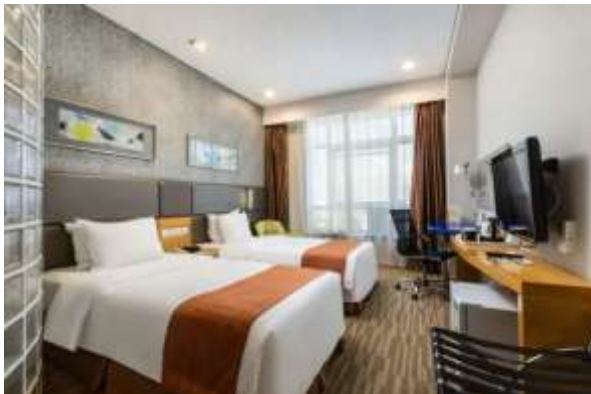
Holiday Inn Express Hotel