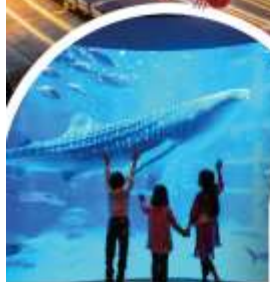
พิพิธภัณฑ์สัตว์น้ำไคยุกิง