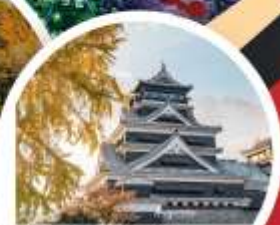
ปราสาทคумаโมโตะ