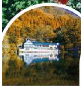
ทะเลสาบคิริน