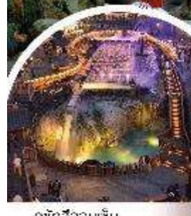
คุซัตสึออนเซ็น