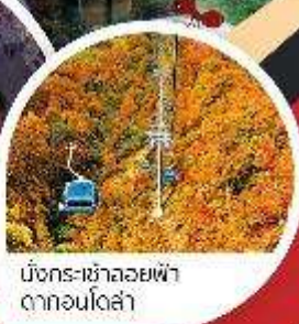
มังกร-ฮาลอลายฟ้า ตากอนโตล่า

Wifi on bus บริการน้ำดื่ม 10 คน ออกเดินทาง