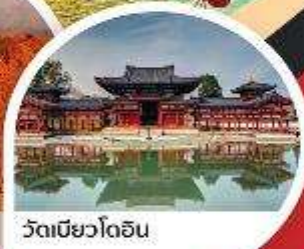
วัดเมียวโดอิน