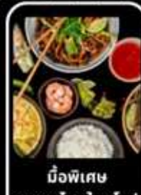
มือพิเศษ