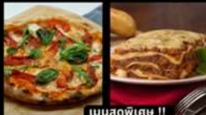
เมนูสุดพิเศษ !!