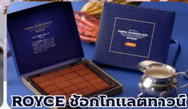
ROYCE ช็อกโกแลตทอว์น