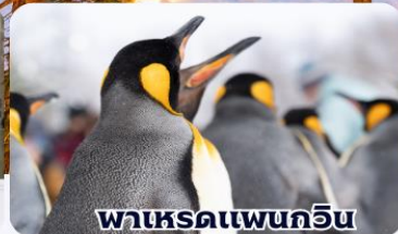
พาเหรดเพนกวิน