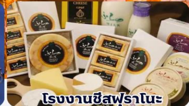
โรงงานชีสฟูรานะ

THAI สายการบินไทย บริการทุกระดับประทับใจ FULL SERVICE