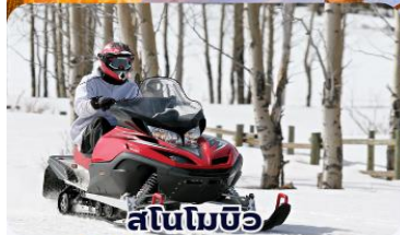
สโนว์แมชีน