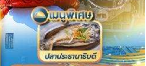
เมนูพิเศษ