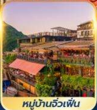
หมู่บ้านจิวเฟิน