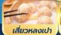
เสี่ยวหลงเปา