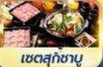
เซตสุกซาบู