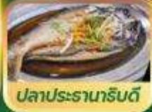
ปลาประจานาหรับดี