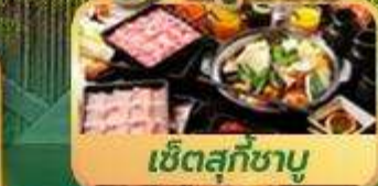
เซตสุกี้ชาบู