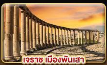
เอรราช เมืองพินเสา