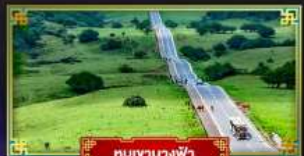
หุบเขานางฟ้า