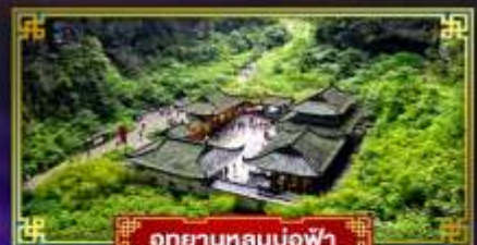
อุทยานหลุมฟ้า