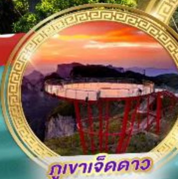
กุหาเจ็ดดาว