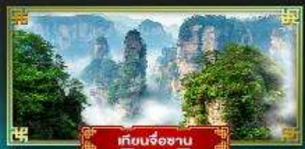
เทียนจ้อซาน