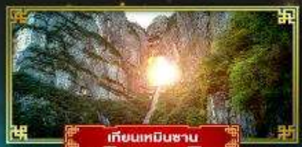
เทียนเหมินซาน