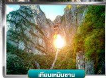
เทียนเหมินซาน