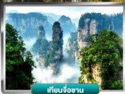
เทียนจื่อซาน