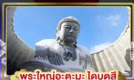
พระใหญ่อะตะมะโดบุตสึ