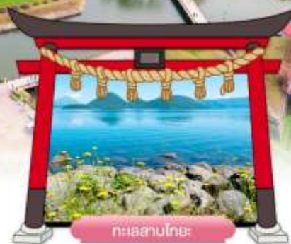
ทะเลสาบโทโย