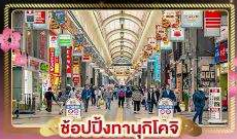
ช้อปปิ้งทานุกิโคจิ