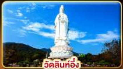
วัดลินห์อิ่ง