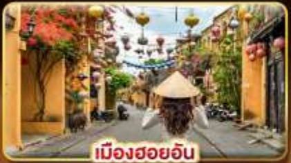
เมืองฮอยอัน