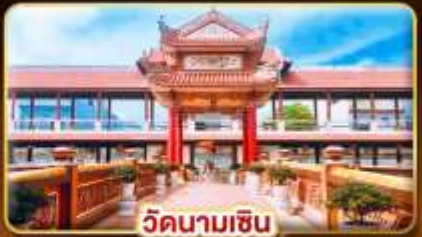
วัดนามเซิน