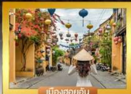
เมืองฮอยอัน