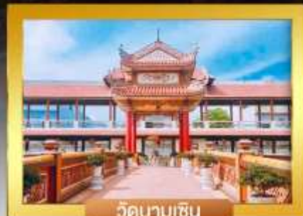
วัดนามเซิน