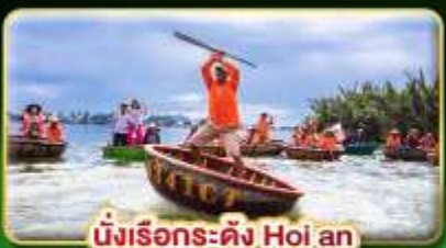
นั่งเรือระดิง Hoi an