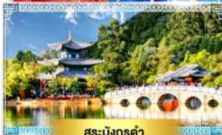
สระมังกรดำ

• เยือนเมืองภาพยนตร์หลงเทียนบาบู "แปดมังกรสวรรค์"