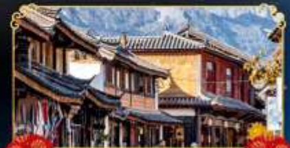
เมืองโบราณโป่ซา