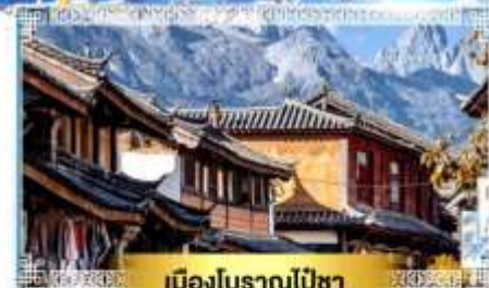
เมืองโบราณไปซา