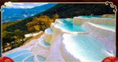
โป๋สุยโก