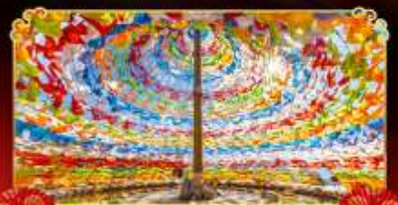
รมนต้อธิฐาน