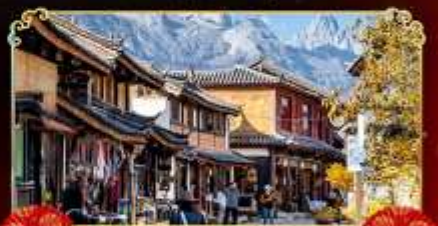
เมืองเก่าไปซา