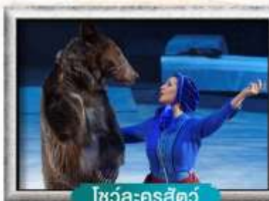
โซว์ล-ครสต์ว์