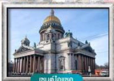
เซนต์ไอแซค