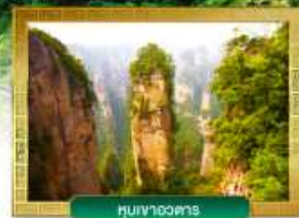
ภูเขาอวดสาร