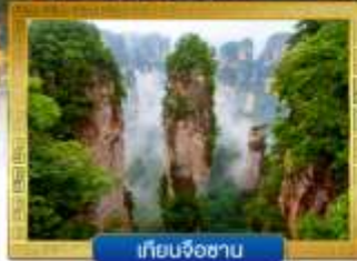
เทียนจื่อซาน