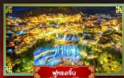
ฟุหลงเจิ่น