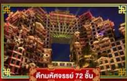
คิมทึคจอร์จี่ 72 ชั้น

นั่งกระเช้าขึ้นประตูสวรรค์ เที่ยวหมู่บ้านโบราณ