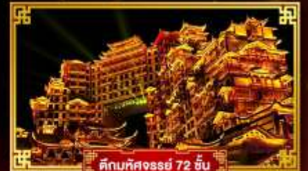
ตึกมหิศงธรย์ 72 ชั้น