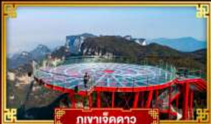
กุหาเจ็ดดาว