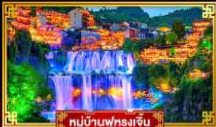
หมู่บ้านฟูหลงเจิ้น