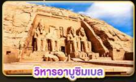
วิหารอาบูซิมเบล

น้ำหนักกระเป๋า 23Kg. (ดูรายละเอียดที่สนามบิน)