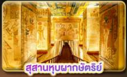
สุสานหุบผากษัตริย์