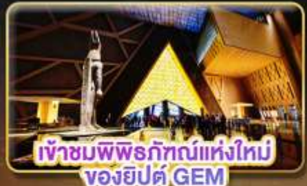
เข้าชมพิพิธภัณฑ์แห่งใหม่ ของยิปต์ GEM