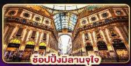
ช้อปปิ้งมิลานจุใจ

119,999.- ราคาเริ่มต้น เดินทาง : 9-16 ก.พ. / 9-16 มี.ค. / 23-30 มี.ค. 88