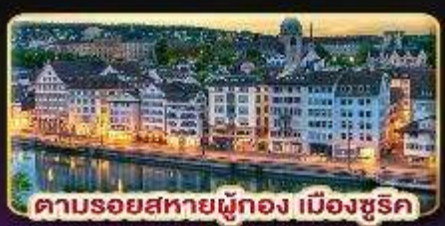
คาบรอยสหายผู้ทอง เมืองซูริก