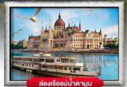
ล่องเรือแม่น้ำดาบูบ

พิเศษ!! ลิ้มลองเมนูประจำชาติ ทั้ง 5 ประเทศ!!!