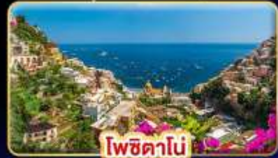
โพซิทานิ