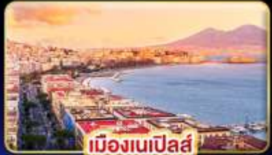
เมืองเนเปิลส์