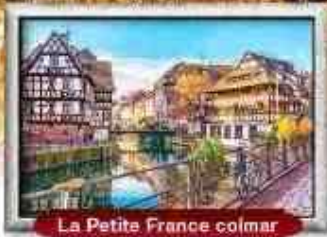
La Petite France colmar

บินหรู สายการบิน Full Service | พิเศษ! หอยแอสคาโก้ อาหาร : 17 มื้อ โรงแรม : 4 ดาว