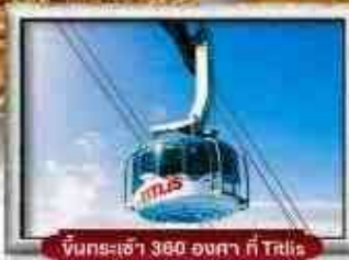
ขึ้นกระเช้า 360 องศา ที่ Talis