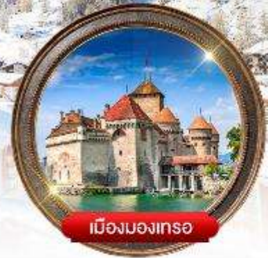
เมืองมงเทรซ