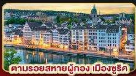
ตามรอยสหายผู้ทอง เมืองซูริค