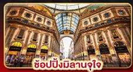
ช้อปปิ้งมิลานจุใจ