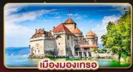
เมืองมงเทร