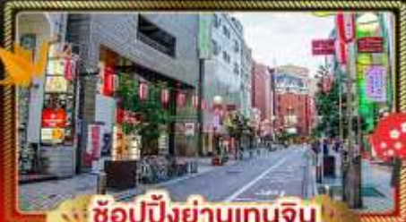
ช้อปปิ้งย่านเทนจิน