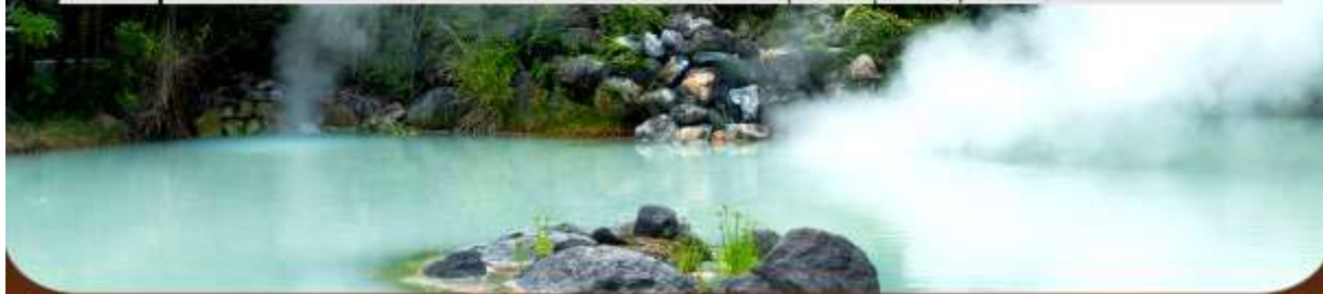
รายการทัวร์อาจมีปรับเปลี่ยนเนื่องตามความเหมาะสม โดยดูสถานการณ์ประจำวันเป็นหลัก #ที่จะเที่ยวครบทุกรายการ