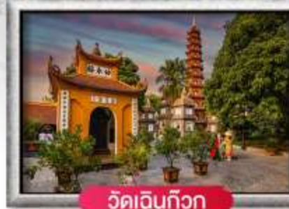
วัดเอนกวิวก