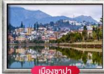
เมืองซาปา