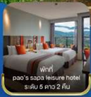
พักรูม pao's sapa leisure hotel ระดับ 5 ดาว 2 คืน