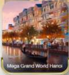
Mega Grand World Hanoi