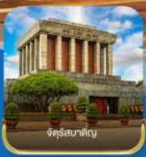
จัตุรัสผาดิย