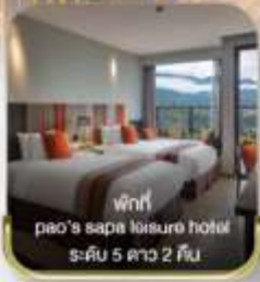
พักที่ pa'o's sapa leisure hotel ระดับ 5 ดาว 2 คืน