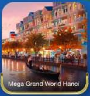
Mega Grand World Hanoi