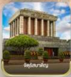
วัดสุรัสวดี