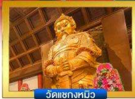
วัดเซ่งก้ง

📍 อีสระ-ช้อปปิงย่านจิมซาจู้ & คอสเวย์เบย์