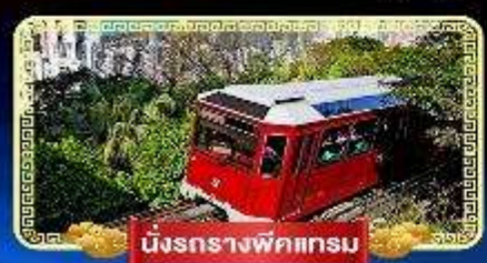
นั่งรถรางพิกเจอร์

นั่งกระเช้ามองปิง 360 องศา บินลัดฟ้าไปมู..สู่เกาะฮ่องกง