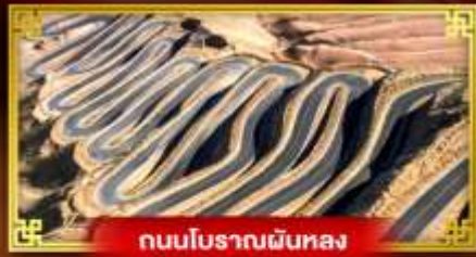
ถนนโบราณผืนหลง

“คัชการ” เที่ยวสุดขอบตะวันตกประเทศจีน เมืองเก่าแห่งยุคเส้นทางสายไหมโบราณ