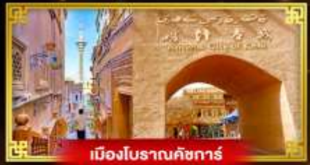
เมืองโบราณคัชการ