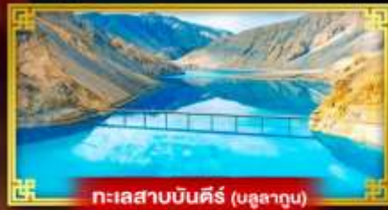
ทะเลสาบบินคัง (บลูลาคุน)