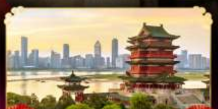
หอถึงหวังเก้อ