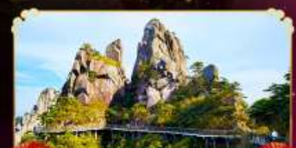
เจาซานซิงซาน