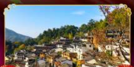
หมู่บ้านทวงหลิง

หมู่บ้านริมผา “หมู่บ้านเทวดาว่างเซี่ยหนู่” เจาสวรรค์ซานซิง มรดกโลกสุดงดงามแดนมังกร