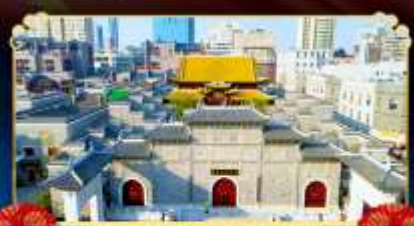
ถนนโบราณวังโซ่งกง

เยือนหมู่บ้านริมผา “หมู่บ้านเทวดาวังเซียนกู่”