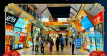
ถนนจินเจีย