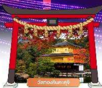
วัดทองคินคะคุจิ