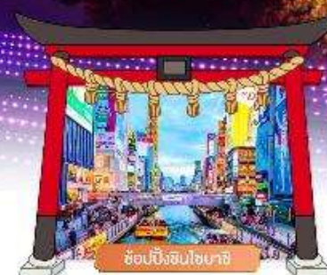
ช้อปปิ้งชินไซบาชิ

เดินทางโดยสายการบิน : ไทยแอร์เอเชียเอ็กซ์