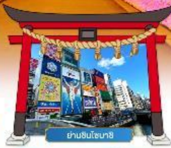
ย่านชินโซนาชิ