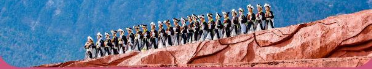
รายการทัวร์อาจมีเปลี่ยนแปลงได้ตามสถานการณ์และนโยบายของบริษัทฯ ขอสงวนสิทธิ์ในสิ่งที่ปรากฏ