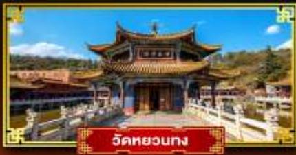
วัดหยวงทง