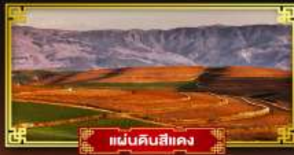
แผ่นดินสีแดง