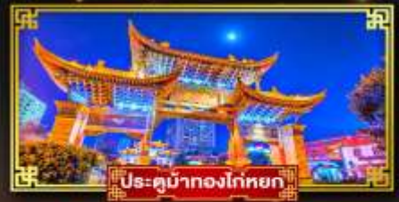
ประตูน้ำทองโก่หยก