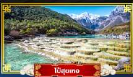
ปี่สุยเทอ