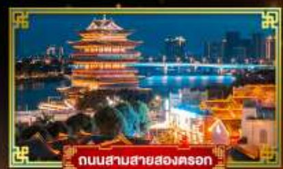
ถนนสามสายสองตอรอก