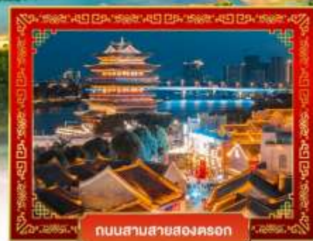
ถนนสามสายสองคอน