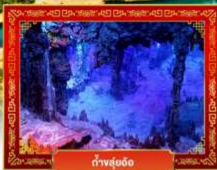
ถ้ำสุ่ยอ้อ