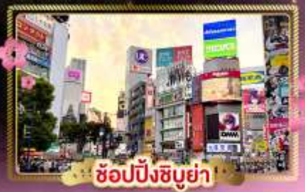
ช้อปปิ้งชิบูย่า