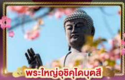
พระใหญ่อุซึคุโดบุตสึ