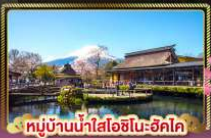
หมู่บ้านน้ำใสโอชิโนะฮักโค