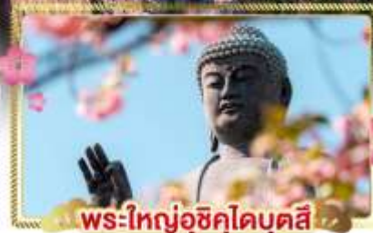
พระใหญ่อุซึคุโอบุคซึ