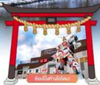
ฮอนบิงทางโอโตะ